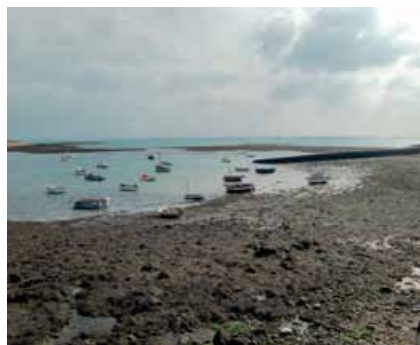
Estran rocheux à marée basse (Iroise).

Il s'agit de renseigner les pêcheurs à pied sur les réglementations en harmonisant les efforts et les supports de communication visant des pratiques de pêche raisonnées et durables. Trois types d'actions sont envisagés :