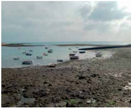
Estran rocheux à marée basse (Iroise).

Il s'agit de renseigner les pêcheurs à pied sur les réglementations en harmonisant les efforts et les supports de communication visant des pratiques de pêche raisonnées et durables. Trois types d'actions sont envisagés :